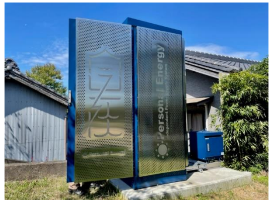
Personal Energy® JIZAI 2021年5月設置 愛知県半田市

※「パーソナルエナジー」の正規取扱いには、一定の条件があります。 我々株式会社Reは、東海地方唯一の正規取扱店となります。