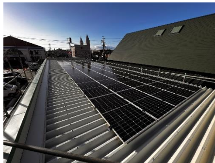
コインランドリー