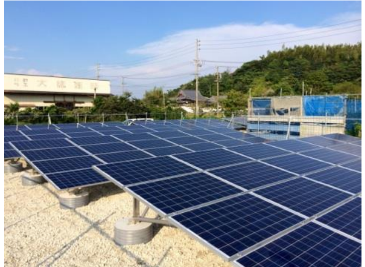
2015年1月設置 愛知県知多郡